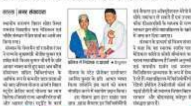
विद्यापीठ के छात्रों को मिलेगा लाभ

विद्यापीठ के छात्रों को मिलेगा लाभ विद्यापीठ के छात्रों को मिलेगा लाभ