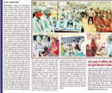
पारा मेडिकल का पर्याय बनता रामचंद्र विद्यापीठ: कुलसचिव

पारा मेडिकल का पर्याय बनता रामचंद्र विद्यापीठ: कुलसचिव पारा मेडिकल का पर्याय बनता रामचंद्र विद्यापीठ: कुलसचिव