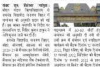
सोनवर्षा रामचंद्र विद्यापीठ को मिला स्थायी संबंधन

सोनवर्षा रामचंद्र विद्यापीठ को मिला स्थायी संबंधन सोनवर्षा रामचंद्र विद्यापीठ को मिला स्थायी संबंधन